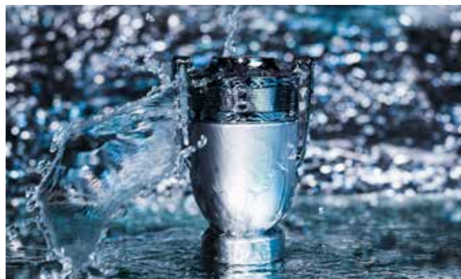
Studioaufnahme im Fach Bildaufnahmetechnik (BAT)

Joachim Graetz, Schulleiter Berufskolleg Foto und Medien