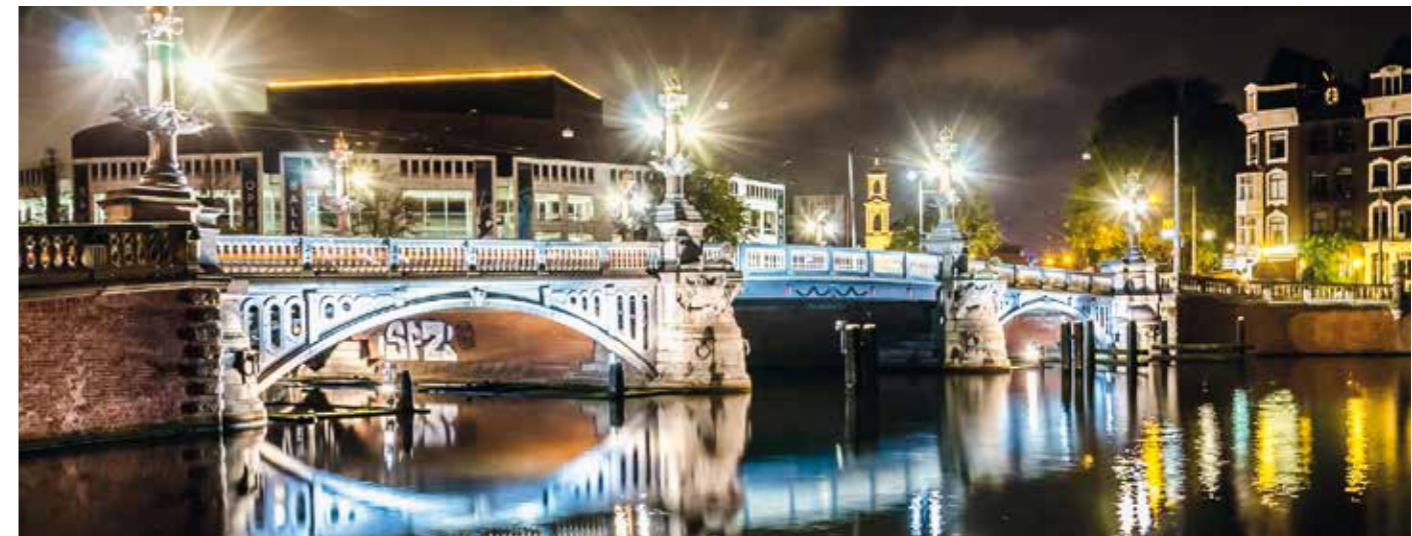
Nachtaufnahme in Amsterdam

Das Berufskolleg Foto und Medien bietet die Möglichkeit einen Einblick in die Arbeit eines Medienschaffenden zu erhalten. Interessenten senden uns eine schriftliche Bewerbung mit Lebenslauf.