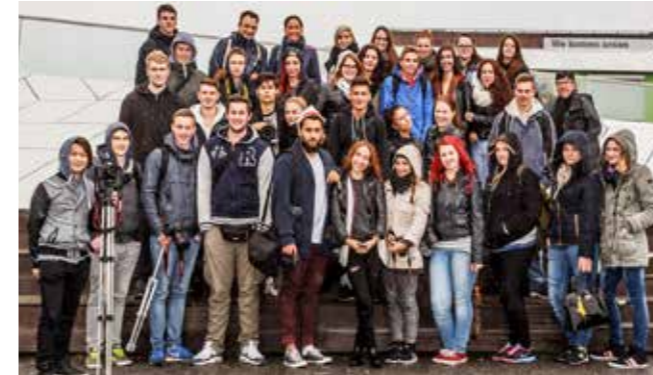
Foto: Exkursion der Abschlussklassen nach Amsterdam

Zusätzlich finden Exkursionen in die Region Stuttgart statt, die den gewohnten Schulalltag auf lebendige Art und Weise unterbrechen und die fotografischen Kenntnisse der Schüler praxisnah erweitern.